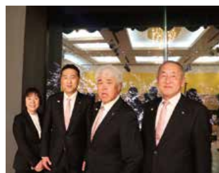
後ろの桜が綺麗ですね