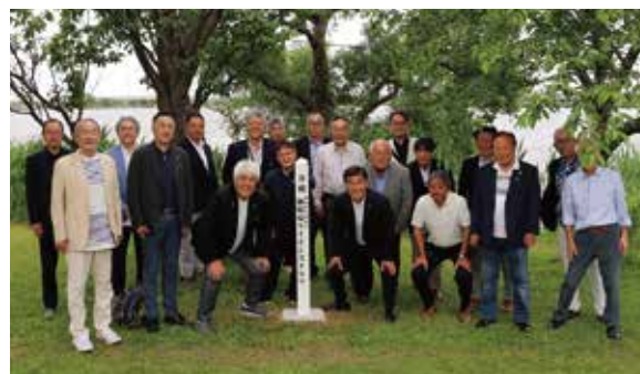
小松・御殿場LC桜の木の下で