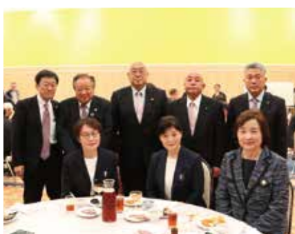
国際ソロプチミストの方々と