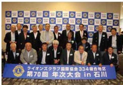
参加ライオンメンバー