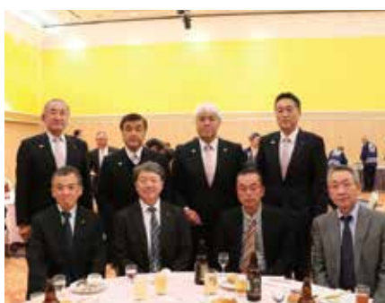
ロータリークラブの方々と