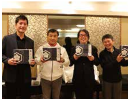
団体戦優勝チーム