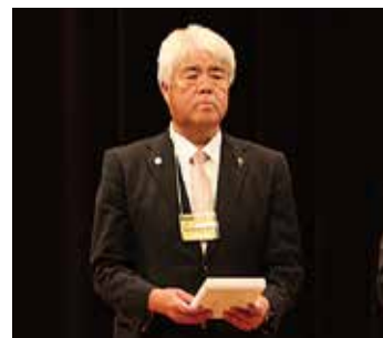
献眼・献腎・献血運動推進賞 いただきました