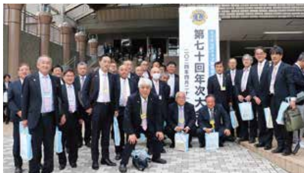
参加ライオンメンバー