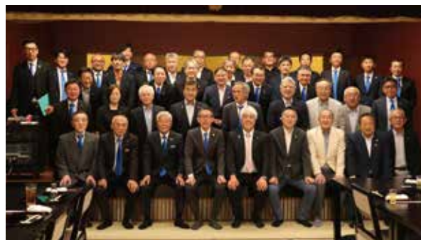
小松LCメンバーとの交流