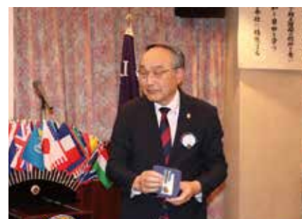
国際協会リーダーシップ アワード贈呈