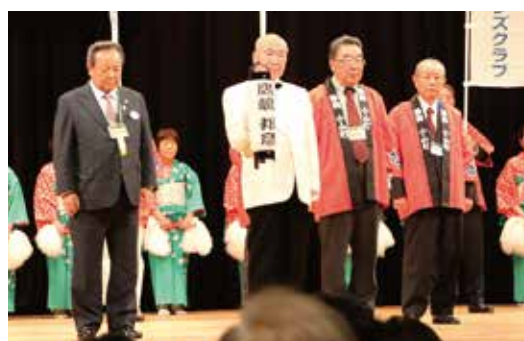
次年度地区ガバナー小山LC