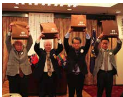
5月誕生ライオンの皆様