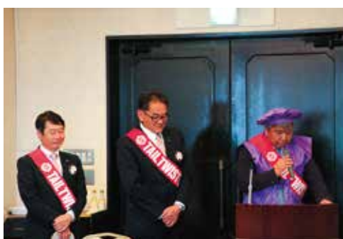
テールツイスター登場