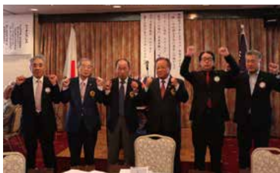
4月誕生ライオンの皆様