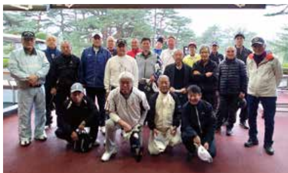
参加メンバーあいにくの雨です