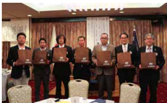
6月誕生ライオンの皆様