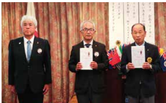
地区年次大会表彰授与