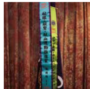
献眼・献腎・献血運動推進賞 会報・ホームページコンテスト賞