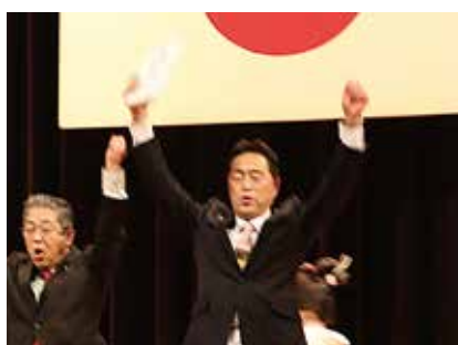
会報・ホームページコンテスト賞 いただきました